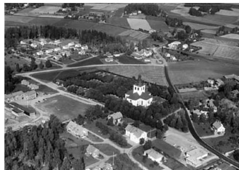
Flygfoto över Västerfärnebo 1963